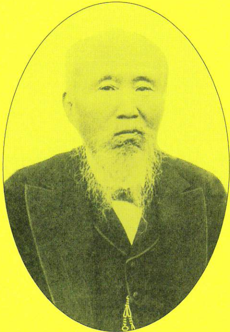
会祖 西村茂樹 (1828～1902年)

募集の趣旨 本会の会祖西村茂樹は、明治9年(1876)日本弘道会の前身である東京脩身学社を興し、一貫して国民道徳の推進と実践のために献身した偉大な思想家であり、道徳の振興と道義国家の建設を唱えた『日本道徳論』を公にして、当時西欧の模倣と追隨に終始していた社会風潮と政治のありかたに警鐘を鳴らし、日本道徳の確立を訴え続けました。 本事業は、本会創立百十周年(昭和61年)を記念して設けたもので、西村茂樹の思想や業績に関する研究者の育成に資するため、研究論文を募集するものであります。 なお、本会では、増補改訂西村茂樹全集(全12巻)(思文閣出版)を刊行しております。